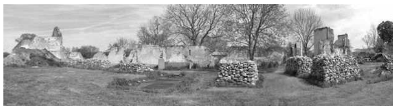
Site de DIODURUM, agglomération antique près de Jouars Pontchartrain appelée « Cité des Dieux »

Les marcheurs ont convergé vers la ferme d'Ythe au départ de Méré/Montfort, les Mesnuls, Ergal, Auteuil le Roi, Neauphle le Vieux, Bazoches...Accueillis par un apéritif gallo-romain qui a eu son petit succès grâce au dévouement de Pascal MANCEAU, les participants ont ensuite pique niqué avant de visiter les lieux sous la houlette d'Olivier BLIN, archéologue en charge du site. Puis ils sont repartis vers leurs villages.